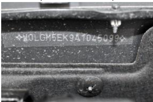
Záber na VIN číslo z motorovej časti