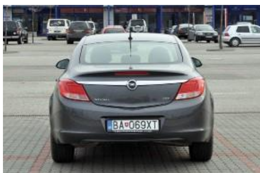
Kolmý záber na celé vozidlo zozadu