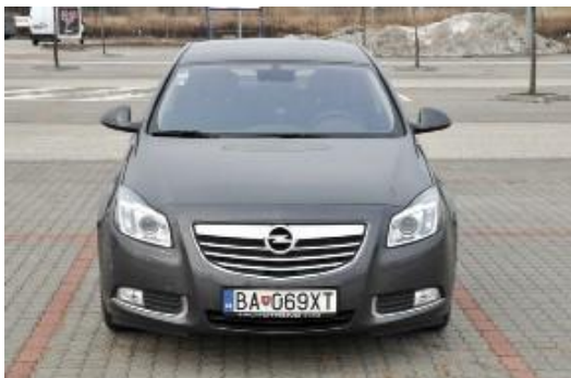
Kolmý záber na celé vozidlo spredu