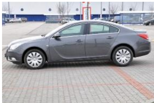
Kolmý záber na celý ľavý bok