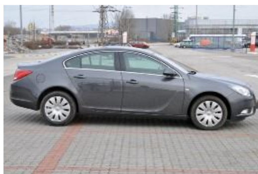
Kolmý záber na celý pravý bok